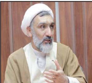
سازای ای دارند، گفت: این یک پرونده قضایی است باید از قضات مربوطه و از سخنگوی قوه قضائیه سؤال شود.

دوازدهم مطرح شد ولی درباره کابینه هیچ انتظار و توقی برای معرفی کسی است، طبعاً این ایام هم اگر پیشنهادی مطرح نباشد و فرصت و مجالی شود به آقای رئیس جمهور و دیگران منتقل می‌شود.