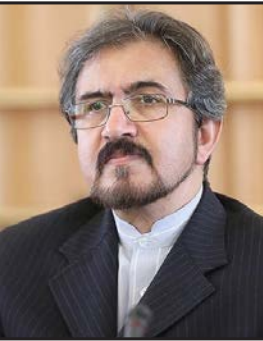
سخنگوی وزات امور خارجه گفت: وزیر امورخارجه اساسا کنشورمان برای ملاقات با رکز تیلرسون وزیر