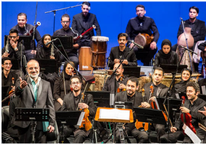
محمد اصفهانی خواننده‌ای که به قول خودش در این سال‌ها کم‌کار شده بود، شامگاه گذشته در کنار ارکستر ملی

پری ملکی - خواننده - و شیرین یزدان‌بخش - بازیگر حضور داشتند. ارکستر ملی ایران که فریدون شهبازیان آن را «نویسا» معرفی می‌کند و می‌گوید، درصد کشف استعدادهای جوان موسیقی است، سال گذشته با خوانندگی علیرضا افتخاری در جشنواره موسیقی فجر به صحنه رفت و در ادامه فعالیت‌های خود، همراه این خواننده در شهرستان خرم‌آباد نیز اجرا کرد. اصفهانی پیش از این درباره اجرا با ارکستر ملی گفته بود: وقتی آقای شهبازیان تصمیم گرفت ارکستر موسیقی ملی را هدایت کند، به‌دلیل این‌که با ذهنیت‌های اجرایی و موسیقایی ایشان آشنایی داشتم، بسیاری از مسائل را ندیده، حل شده دیدم و چشم‌پسته پیشنهاد ایشان را پذیرفتم.